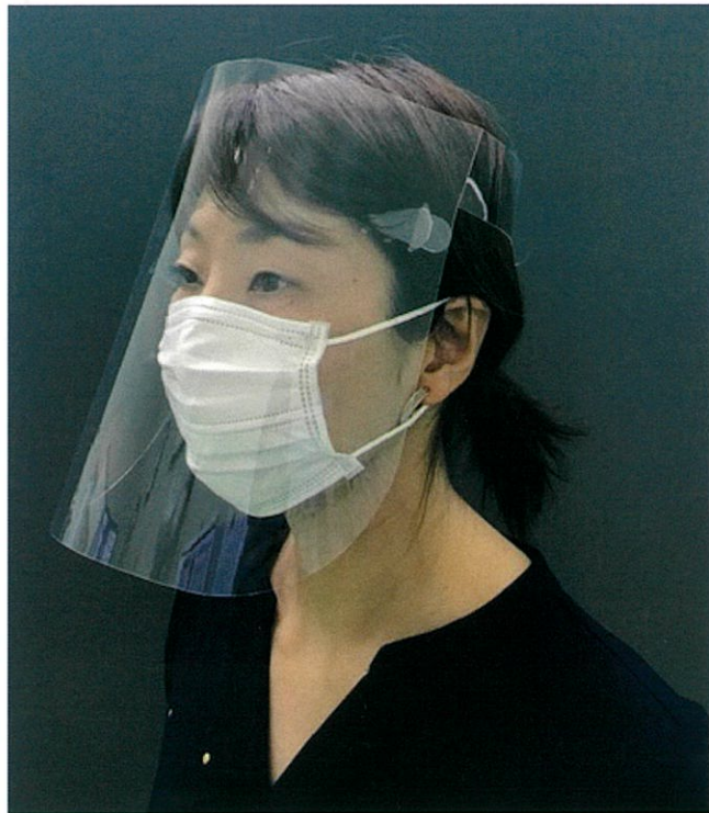
写真は小サイズを使用しております